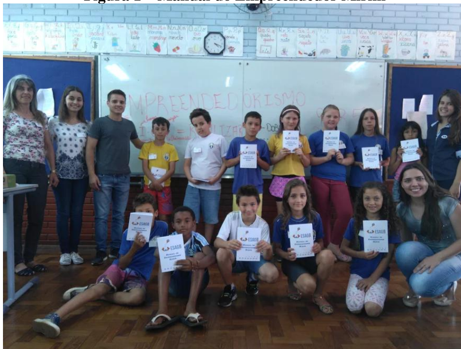
Figura 1 – Manual do Empreendedor Mirim

Legenda: Manual do Empreendedor Mirim nas mãos dos estudantes da Escola de Educação Básica Dr. Sidney Guerra, em Erechim/RS, numa parceria de ação extensionista da UDESC com a UERGS.